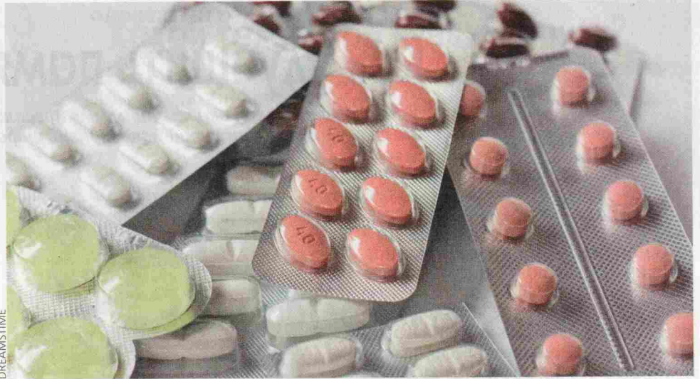
О побочных действиях медикаментов информирует Patientenberatung

– Какие доказательства в подобных ситуациях можно использовать? Име-